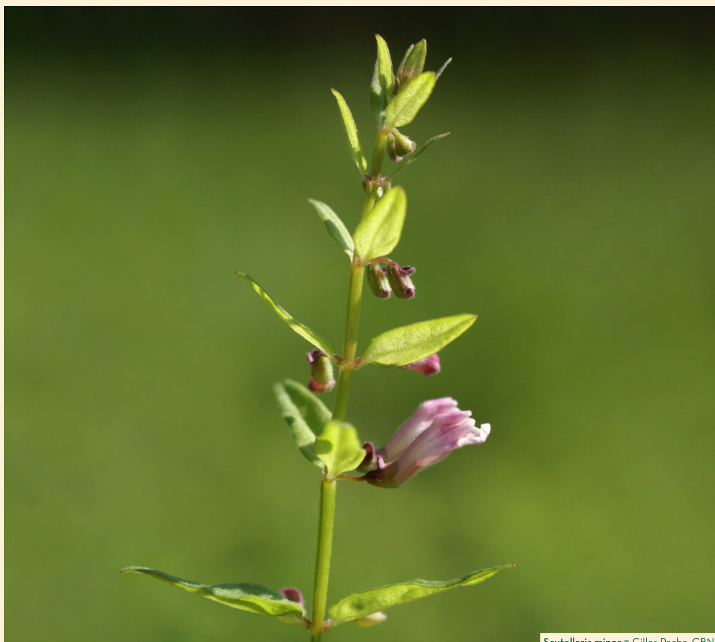
Scutellaria minor

* Espèce avec un statut de protection : n : nationale ; ra : Rhône-Alpes ; auv : Auvergne ; 01 : Ain ; 42 : Loire ; 74 : Haute-Savoie