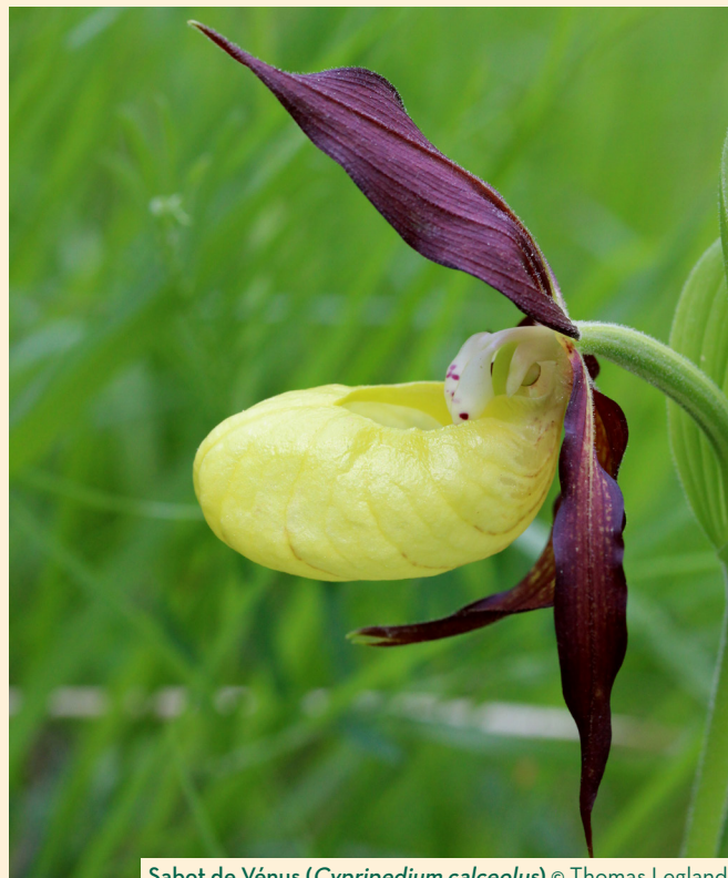
Sabot de Vénus ( Cypripedium calceolus )