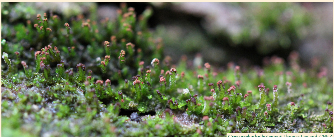
Crossocalyx hellerianus © Thomas Legland, CBNA

* Espèce avec un statut de protection : n : nationale ; ra : Rhône-Alpes ; auv : Auvergne ; 01 : Ain ; 42 : Loire ; 74 : Haute-Savoie