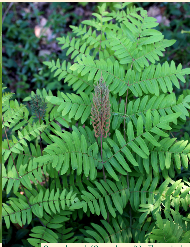
Osmonde royale ( Osmunda regalis )